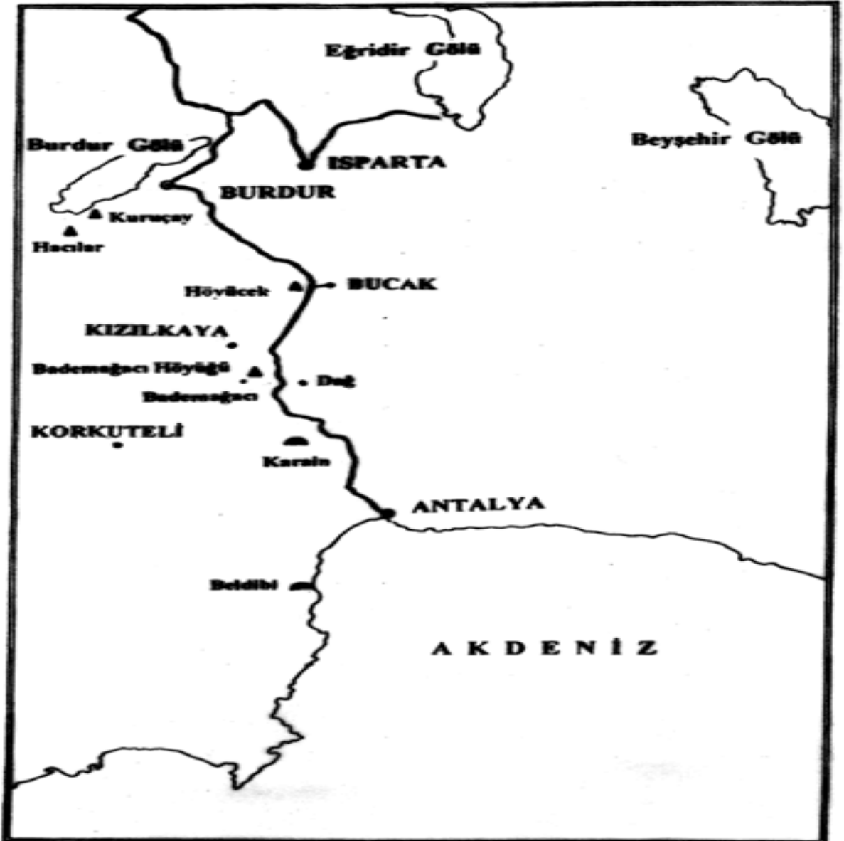
RESİM - 1 ( HARİTA)

1972' de Belediye Teşkilatı kurularak KASABA / BELDE olmuştur. Bugünkü yerleşik nüfusu 4000 dolaylarındadır.